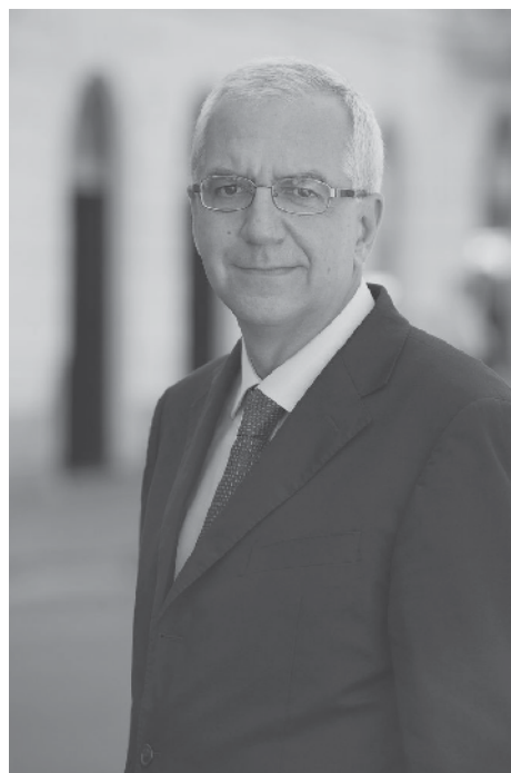
Dario Focarelli , direttore generale di Ania

Nonostante i citati fattori di incertezza, i preparativi delle imprese procedono secondo i programmi. “Ritengo – sottolinea Focarelli – che il mercato assicurativo italiano sarà pronto alla scadenza del primo gennaio 2016 e, del resto, i preparativi hanno subito un’accelerazione già lo scorso anno, quando l’ Ivass ha dichiarato di volersi conformare alle linee guida di Eiopa, introducendo, in via anticipata, alcune regole in materia di governance e reporting alla Vigilanza. Credo che proprio in quest’ultima area, si celino le possibili maggiori criticità: la necessità di raccogliere dati nuovi e di qualità, da un lato, e di inviare periodicamente report molto analitici alla vigilanza, dall’altro, rappresentano impegni molto gravosi