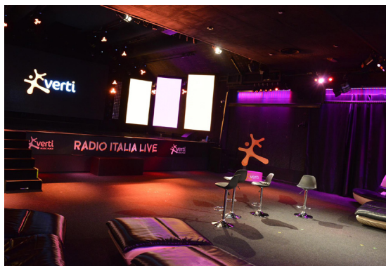
Il Verti music place a Radio Italia

“Ci attende un anno ricco di sfide, con l’obiettivo di tenere alta la profittabilità, come fatto nel 2017, in cui il conto economico è cresciuto del 75%”, ha rivelato Flores-Calderón a Insurance Review. Per il manager spagnolo, la forza di Verti consiste nell’aver alle spalle una multinazionale come Mapfre: 36 mila professionisti e 37 milioni di clienti nel mondo, tra i principali gruppi assicurativi europei nel ramo non-vita per raccolta premi. “Antonio Huertas Mejías, il nostro chairman, ha detto che l’Italia è strategica per lo sviluppo