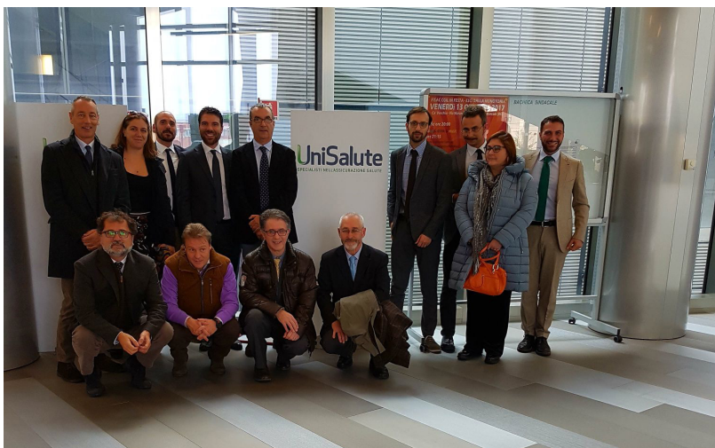
La delegazione di Amca in visita presso la sede di UniSalute